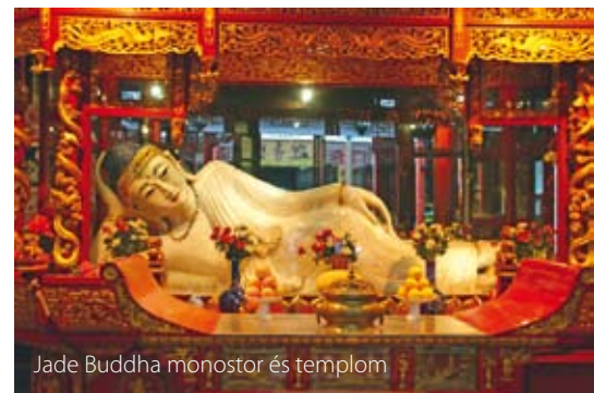
Jade Buddha monostor és templom

Sanghaj építészettörténelmi emlékeit a Sou-hszi városrész őrzi. A város egyik fő nevezetessége a ma is működő Jade Buddha monostor és templom, ahol értékes, csillogó fehér jadéból készült Buddha-szobrokat találunk. Az óváros egyik ékköve az Örömök kertje, a kínai kertépítészet remekéeként is ismert mandarinkert. A XVI. század óta két hektáron mintegy 30 különböző dél-kínai kert terül el itt. Sanghaj sok évszázadon át csendes kis halászfalu volt, csak a XIX. században, az ópiumháborúkat követően vált jelentős kikötővé. A város Wall Streetje a Bund, ahol a XX. század elején monumentális épületeket építettek az európai bankok és biztosítók. A Huangpu folyó