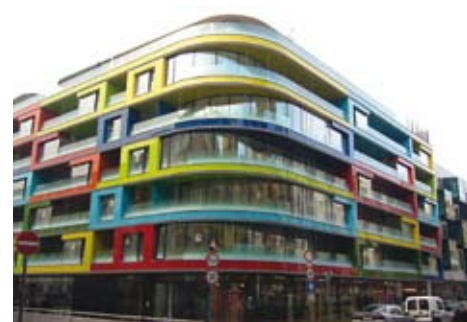
Simplon Udvar, Budapest