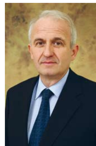
RÉDEY ÁKOS, a Pannon Egyetem rektora

A Pannon Egyetem a magas szintű felsőfokú oktatás és doktori képzések mellett a kutatás-fejlesztésre és az innovációra is nagy hangsúlyt fektet. Az egyetem kiemelt célja, hogy a Közép-dunántúli Régió innovációvezérelt tudásközpontjaként működjön, valamint hogy a régió gazdasági szereplőivel kialakított kapcsolatait fejlessze és további együttműködésekhez hozzon létre. Ezért nemzetközileg is elismert professzorainak bevonásával jól felszerelt laboratóriumi környezetben biztosítja a kutatás-fejlesztési programok megvalósulását. Eddigi eredményeikre és kapcsolataikra építve keresik a határon átnyúló regionális együttműködések.