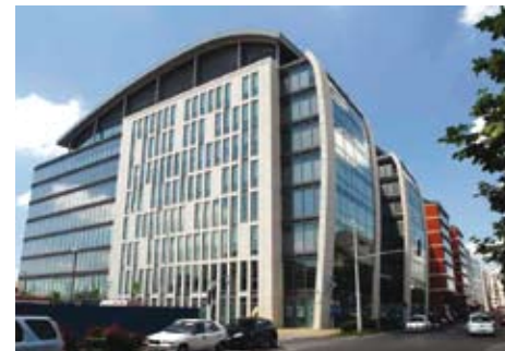
Millennium 7/b, Budapest