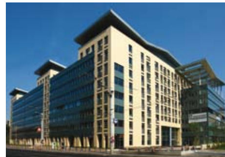
Capital Square, Budapest