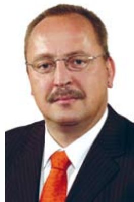
Németh Zsolt, a Fidesz külügyi szakpolitikusa

A Kárpát-medencei gazdasági régióban való magyar részvétel össznemzeti feladat, ezért a térség értelmezéséről és a regionális fejlesztésnek a következő ciklusra vonatkozó koncepciójáról a megalakuló országgyűlés pártjainak szakpolitikusait kérdeztük.