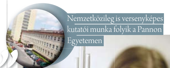
Nemzetközileg is versenyképes kutatói munka folyik a Pannon Egyetemen

Kutatás-fejlesztési és innovációs eredményeiket egyrészt spin-off cégeknek keresztül (Ökoret Spin-off Zrt., Pannon Bio-Innováció Kft.), másrészt klaszterek révén (ÖKopolisz Klaszter, Pannon K+F+I+O Klaszter, e-Közigazgatási Klaszter, Mobilitás és Multimédia Klaszter, Pannon e-Oktatási Klaszter, Zöld Klaszter, Ajkai Járműipari és Mechatronikai Klaszter) hasznosítják. Ezek mellett a megvalósításban fontos szerepet játszanak azok az operatív programok is, amelyek uniós támogatással valósulnak meg.