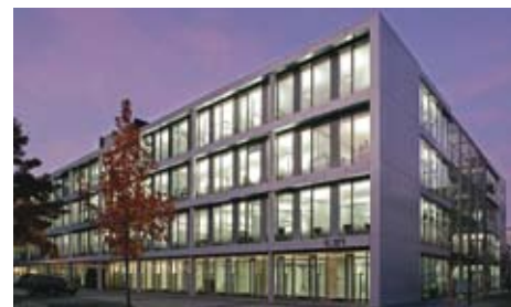
Daimler-irodaépület, Stuttgart Untertürkheim

Már ma büszkén mondhatjuk el magunkról, hogy azon kevés magyar építőipari cég közé tartozunk, amelyeket külföldi befektetők is partnerként fogadnak el projektjeikben, kivitelezéseikben.