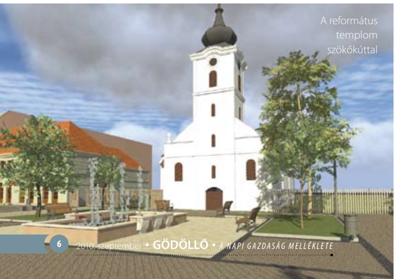
A református templom szökőkúttal

A városvezetés célja, hogy a főteret lélekteljesen töltsék meg, ahol a város lakói és a turisták egyaránt szívesen időznek majd. Az Erzsébet királyné Szálloda és a református templom közötti részen kültéri sakk-, míg az Atrium üzletház és a Polgármesteri Hivatal parkolója közötti részen malomjáték-táblát építenek be a burkolatba. A városháza előtti rendezvényter funkciója nem változik, azonban a hivatalhoz illeszkedő része zöldfelületekkel gazdagodik, látványos pihenőtérre alakul. Ennek a térrésznek fontos szerepe lesz abban, hogy átvezesse a látogatókat a Gábor Áron utcába. A rendezvényter térburkolatú felületekkel bővül, így itt lehetővé válik téli-nyári kirakodóvásárok, közösségi programok megrendezése is.