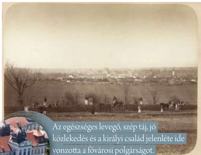
Az egészséges levegő, szép táj, jó közlekedés és a királyi család jelenléte ide vonzotta a fővárosi polgárságot.